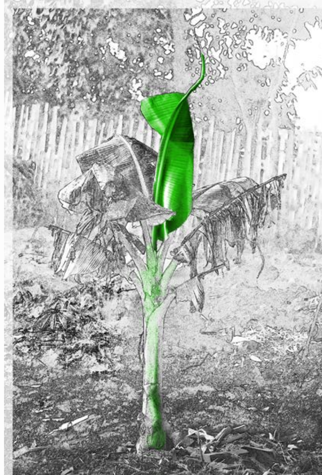
“Después de la tempestad”

Mientras estemos caminando por la vida, vamos a encontrar momentos difíciles pero, de lo más profundo de nuestro ser, siempre, brotan nuevas esperanzas.