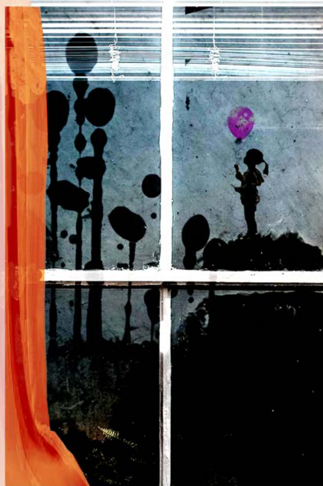
“Un globo rosa”

Cada cierto tiempo deberíamos dejar salir nuestro niño interior y observar cómo juega con globos de colores.