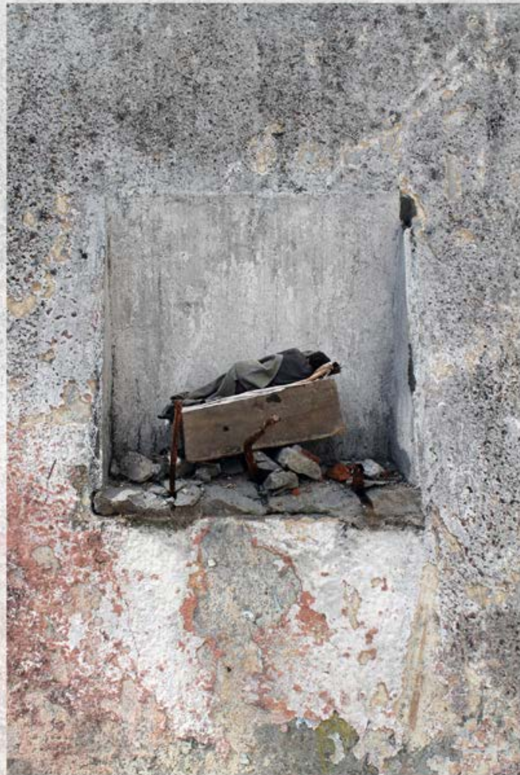
“De la serie nichos 2”

No importa el lugar, saca un tiempo para hacer un alto en el camino y descansar.